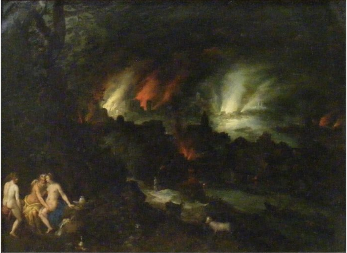
Jan Brueghel l'Ancien