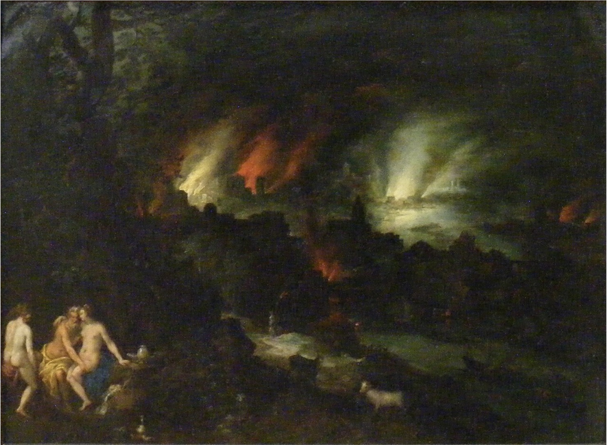
Jan Brueghel l'Ancien

J'ai ouï assez souvent, nos vieux, dire : « qu'il n'y a de pire ennemi à l'homme que lui-même ».