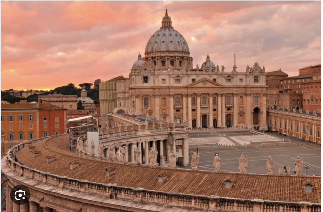
La Basilique Saint-Pierre