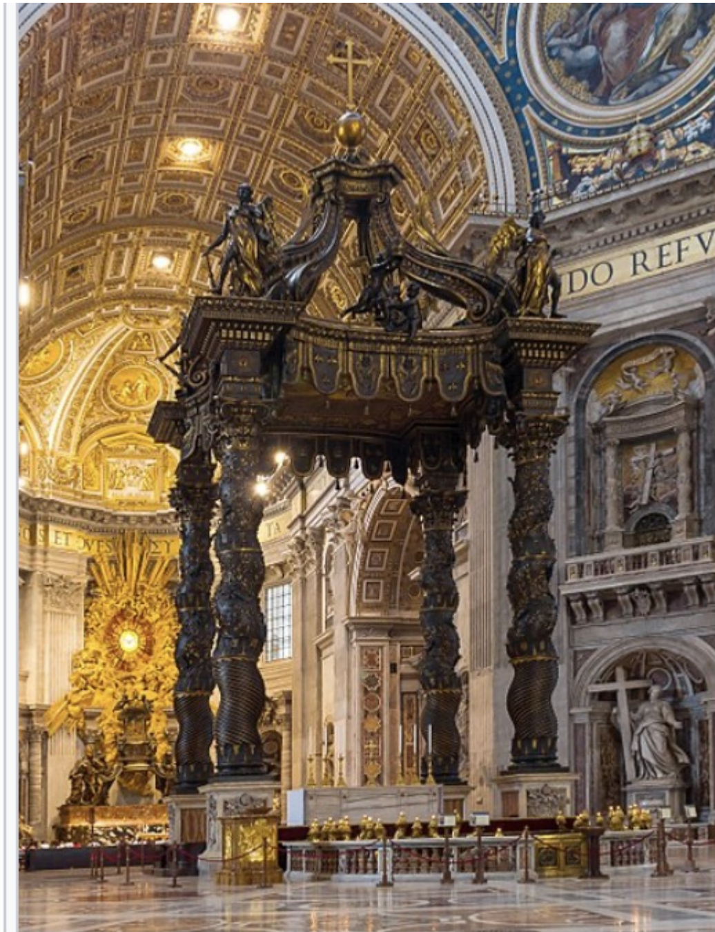
Le baldaquin du Bernin .

réalisé par Le Bernin , de 1624 à 1633 .