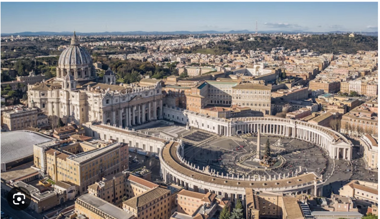
Chef-d'oeuvre du trompe-l'oeil, du baroque, entre autres, la place Saint-Pierre