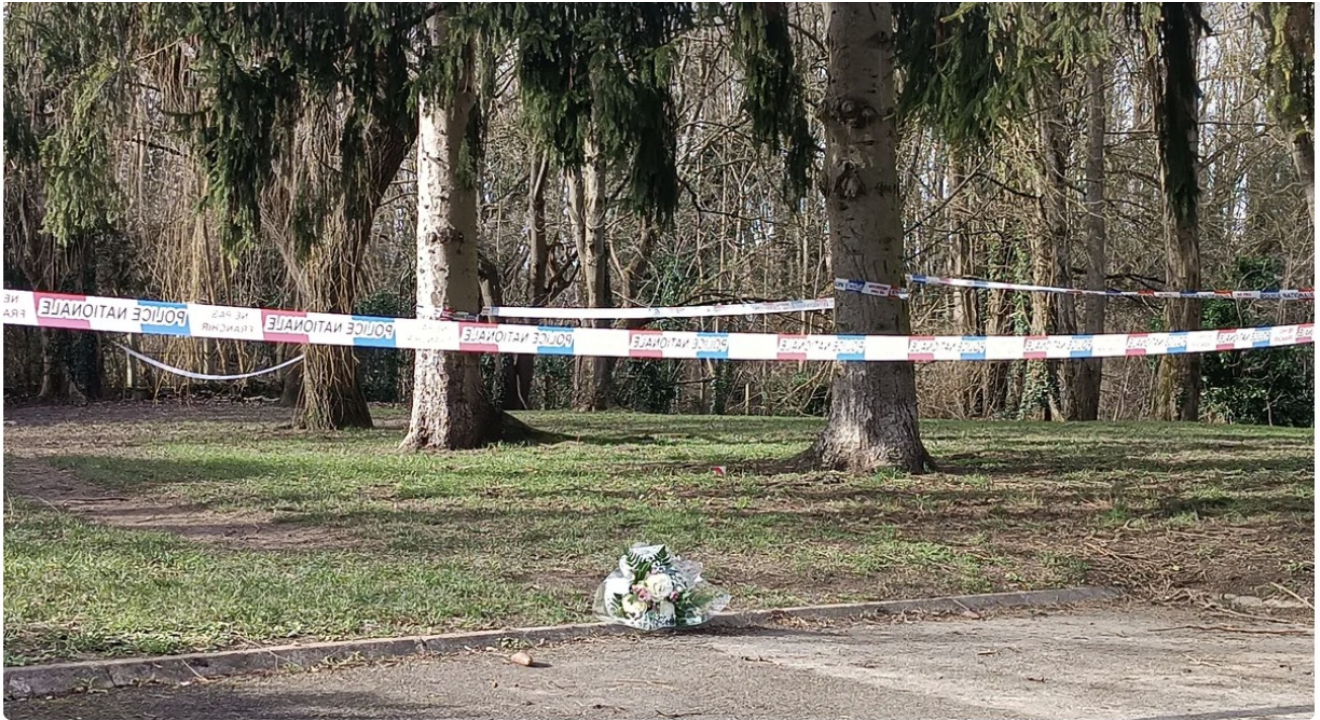
Le corps de la collégienne a été retrouvé dans le bois des Templiers à Longjumeau (Essonne).