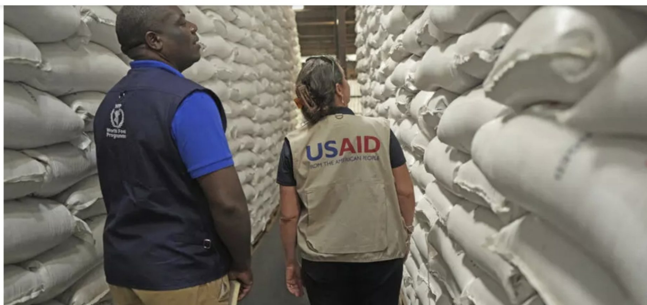
Des employés de l'USAID et du Programme alimentaire mondial inspectent des sacs de nourriture destinés à 2,7 millions de villageois. Harare, au Zimbabwe, le 17 janvier 2024.