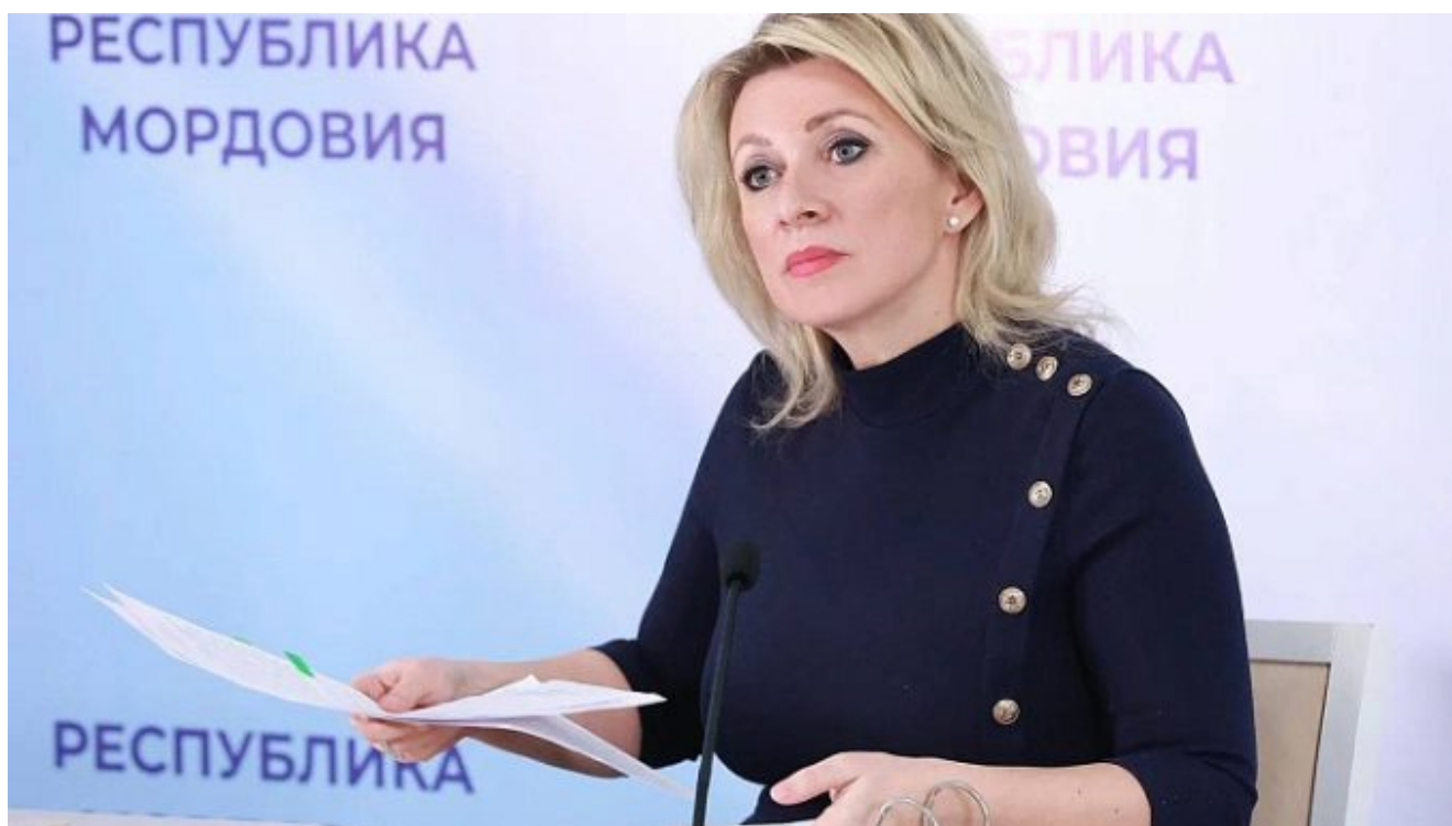
Maria Zakharova, porte-parole du Ministère des Affaires étrangères de la Fédération de Russie