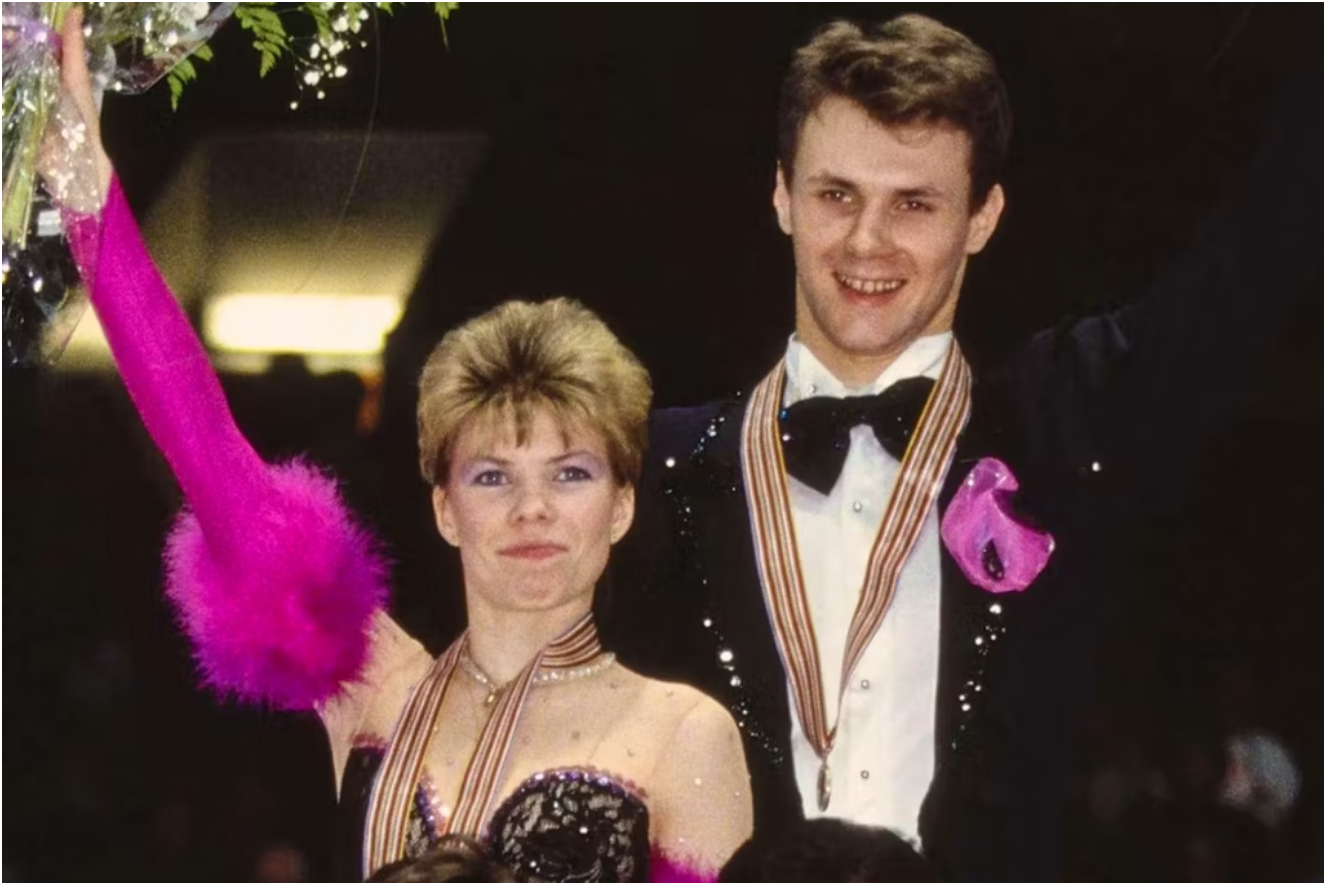
Evgenia Shishkova, 52 ans, et Vadim Naumov, 55 ans, avaient été sacrés champions du monde en mars 1994.

Mariés en 1995, Evgenia et Vadim ont formé un couple harmonieux tant dans leur vie personnelle que professionnelle. Leur complicité et leur grâce sur la glace ont captivé les spectateurs du monde entier. Leur participation aux Jeux Olympiques d'hiver en 1992 et 1994 a été un moment fort de leur carrière, bien qu'ils n'aient pas décroché de médaille olympique.