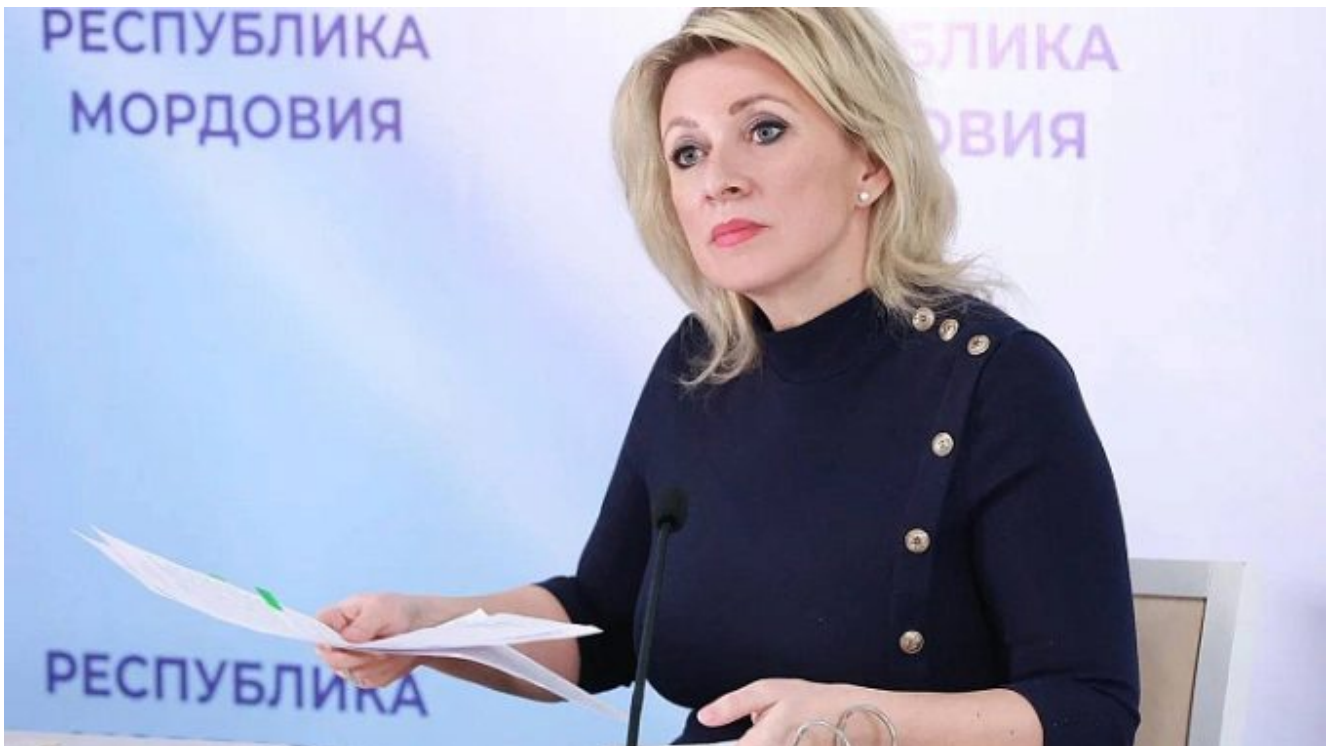
Maria Zakharova, porte-parole du Ministère des Affaires étrangères de la Fédération de Russie