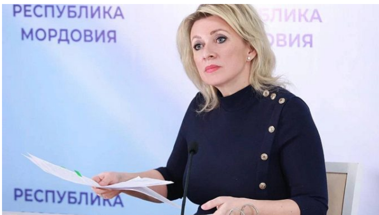
Maria Zakharova, porte-parole du Ministère des Affaires étrangères de la Fédération de Russie

Ce vendredi 31 janvier, Moscou a confirmé le décès des patineurs russes Evgenia Shishkova et Vadim Naumov dans le crash aérien du mercredi 29 janvier faisant 67 morts. La porte-parole de la diplomatie russe exprime les condoléances « aux familles, à tous les Américains ».