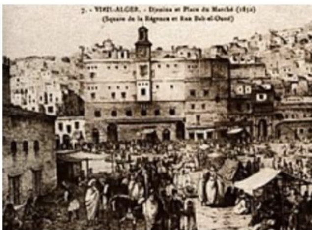
ALGER MARCHÉ AUX ESCLAVES 1832

écrit par Thérèse Zrihen-Dvir | 2 février 2025