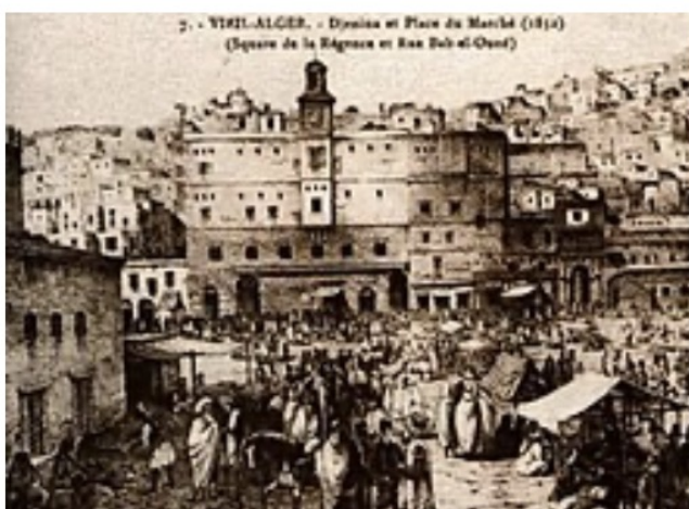
ALGER MARCHÉ AUX ESCLAVES 1832