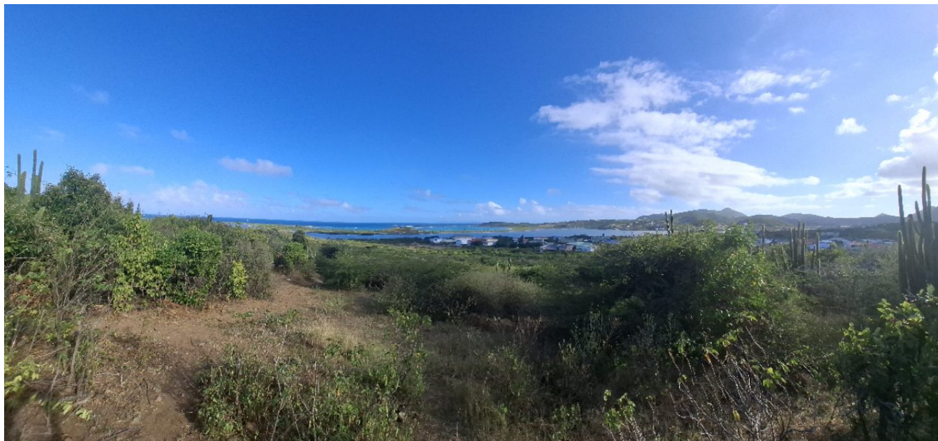
Point de vue sur la plage du Galion et sur Quartier d'Orléans au fond. Île de Saint-Martin