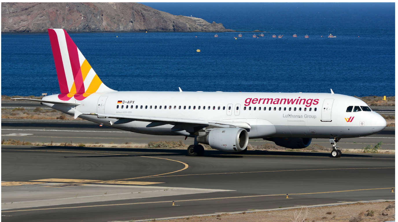
Illustration : l'Airbus A320 D-AIPX qui s'est écrasé dans le massif des Trois-Évêchés le 24 mars 2015.