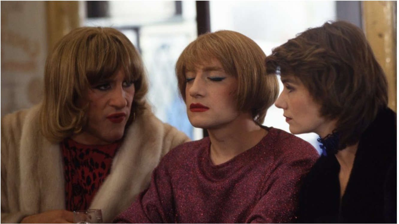
Tenue de soirée , Bertrand Blier, 1986 avec Gérard Depardieu, Michel Blanc, Miou-Miou. En entier ici