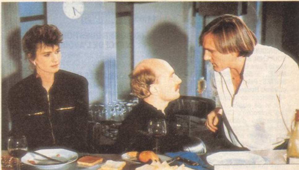
Monique (Miou-Miou), Antoine (Michel Blanc) et Bob (Gérard Depardieu)

Dans un dancing de la région parisienne, une jeune femme plutôt triste, Monique, houspille publiquement son compagnon, Antoine, parce qu'il ne lui offre que des mots d'amour alors qu'elle rêve d'une vie de luxe. Fragile, effacé, Antoine subit sans broncher l'humiliation. C'est alors qu'un homme à la carrure d'athlète, Bob, s'approche d'eux et gifle violemment Monique avant de lui jeter dédaigneusement une liasse de billets.