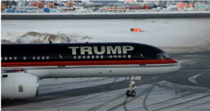
L'avion de Donald Trump Jr. à Nuuk, le 7 janvier 2025.