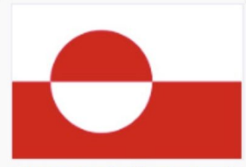
Drapeau du Groenland.