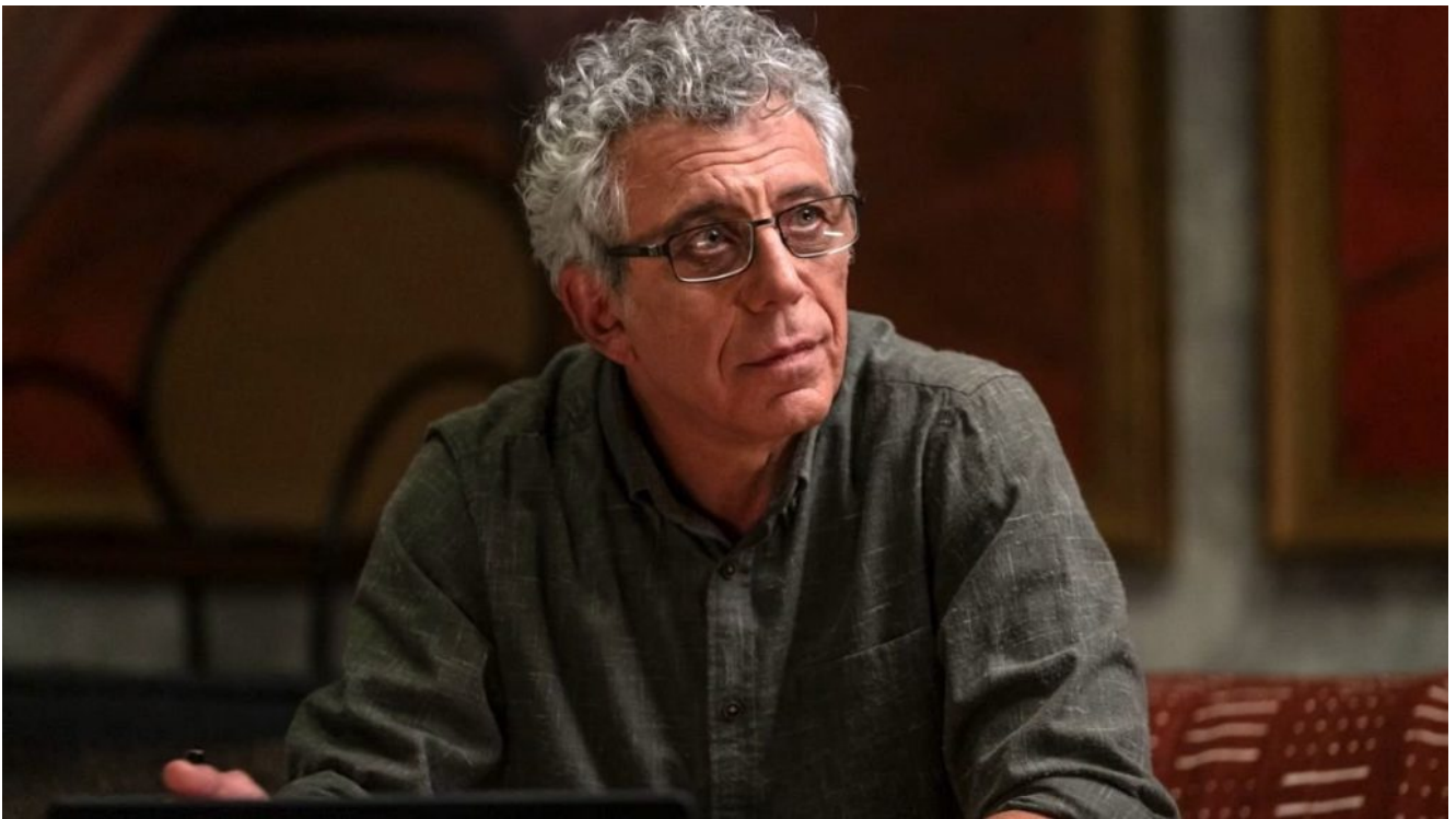
Enfin, l'excellent acteur Eric Bogosian : Daniel Molloy (le journaliste)