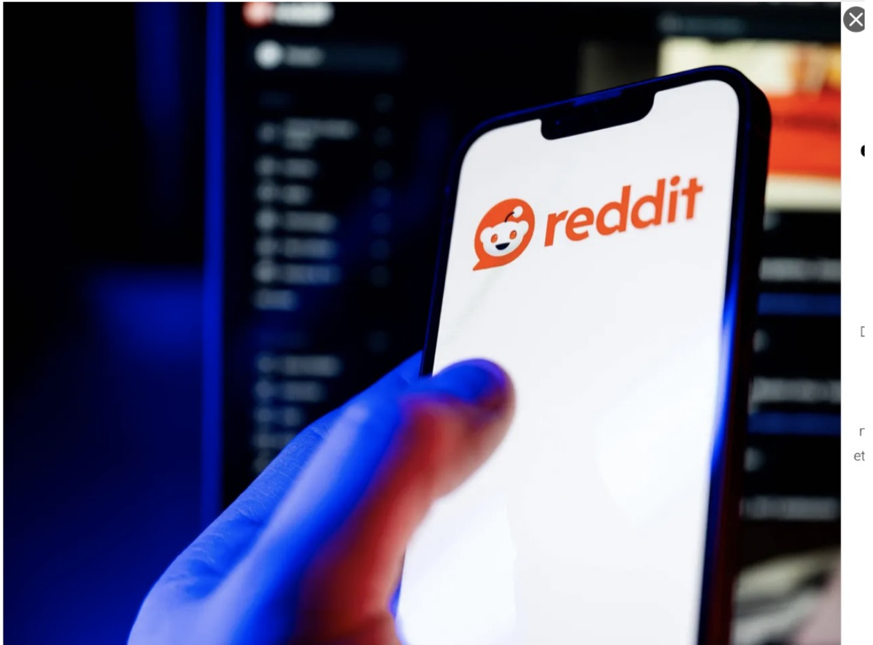
Reddit, un réseau social où l'on ne pourra plus citer les médias déplaissant aux modérateurs.

Ça pue chaque jour davantage les copains, non ? A moins qu'il ne faille positiver et se dire que c'est parce qu'ils ont une peur bleue de la Résistance qui monte, qui monte... qu'ils prennent des remèdes sauvages ? Annulation d'élections en Roumanie, manipulations électorales partout ailleurs, Der Leyen qui ratifie toute seule en catimini le Mercosur, censure sur RT France, twitter, Facebook pour cause de Covid, de guerre Russie-Ukraine,.. des fois que des pro-Russes puissent expliquer au peuple d'ignorants qu'il se fait manipuler par les medias aux ordres subventionnés... Et à présent c'est la lutte finale contre les medias patriotes, anti-mondialistes, anti-européistes, ceux qui osent dire que l'UE est une dictature et l'immigration un fléau.