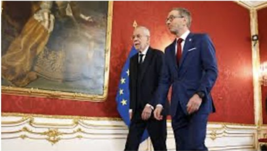
À gauche, Alexander van der Bellen et Herbert Kickl nouveau chancelier d'Autriche