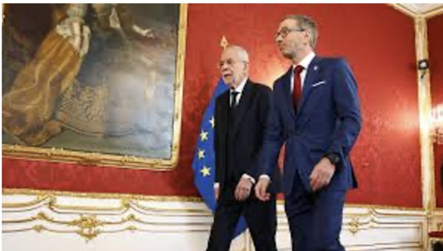
À gauche, Alexander van der Bellen et Herbert Kickl nouveau chancelier d'Autriche

Habeck, Hitler repeint en Vert, provoque un tsunami contre la liberté d'expression, non seulement en Allemagne, mais dans l'Uerss jusqu'à Auschwitz.