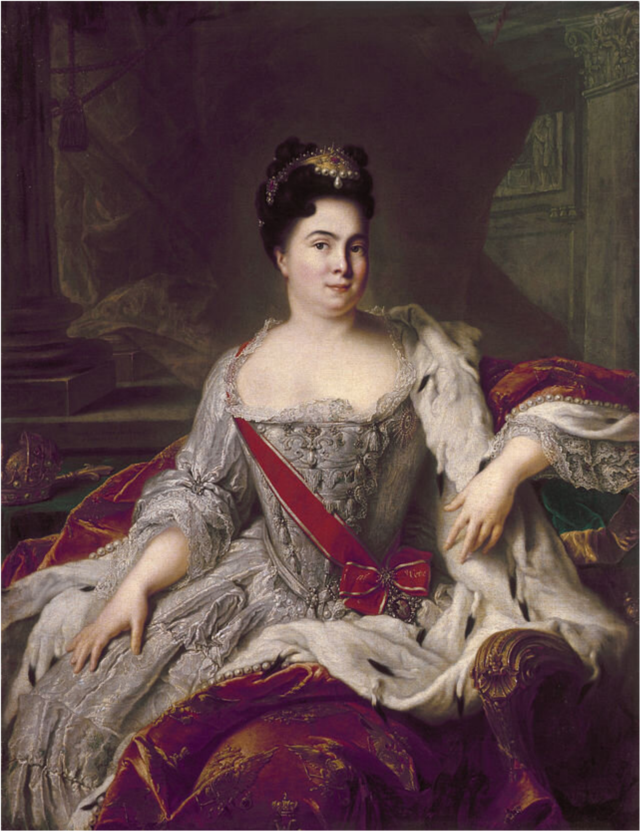
Le Salon de Lyon