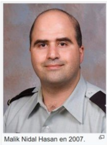
Malik Nidal Hasan en 2007.

Le fait que des militaires américains de religion musulmane, en situation active ou non, commettent des carnages sur le sol des États-Unis, n'est pas surprenant.