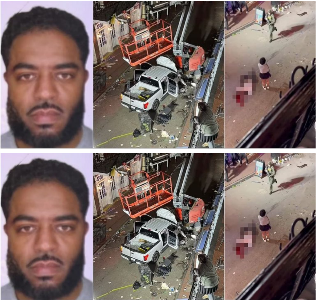
A gauche, le terroriste Shamsud Din Jabbar