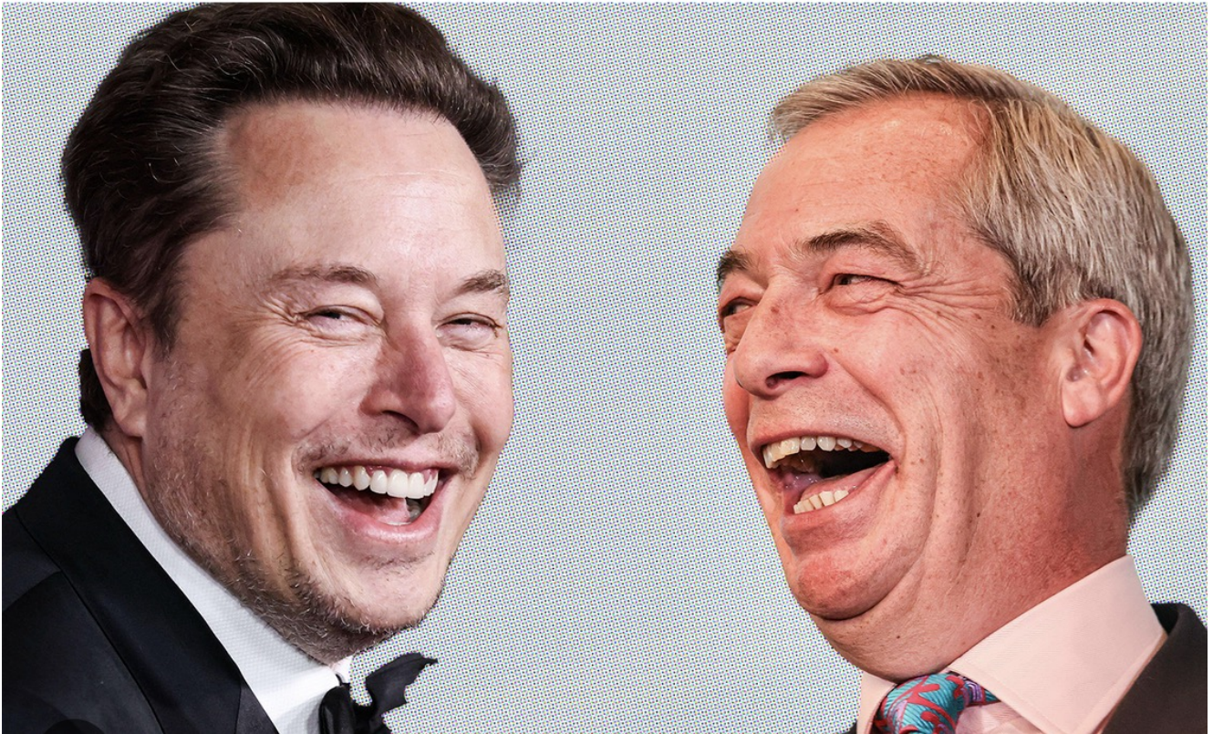
Elon Musk et Nigel Farage

Ce Musk est fascinant. Au lieu de s'acheter des villas à Marrakech et des avions pour aller porter la parole mondialiste dans le monde entier comme le dégénéré Gates, il utilise sa fortune pour faire avancer la science, (la vraie, pas les impostures des écolos-dingos) et aider les patriotes du monde entier, très seuls jusqu'à présent, pour ne pas dire dans une situation désespérée.