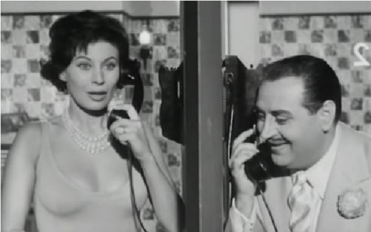
Dario Moreno, Magali Noël

Quelques mois plus tard, il partage l'affiche avec la sublime Brigitte BARDOT, mais aussi un débutant du nom de Serge GAINSBORG, dans « Voulez-vous danser avec moi ? », réalisé par Michel BOISROND.