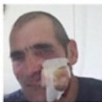
Guy, blessé à Bordeaux