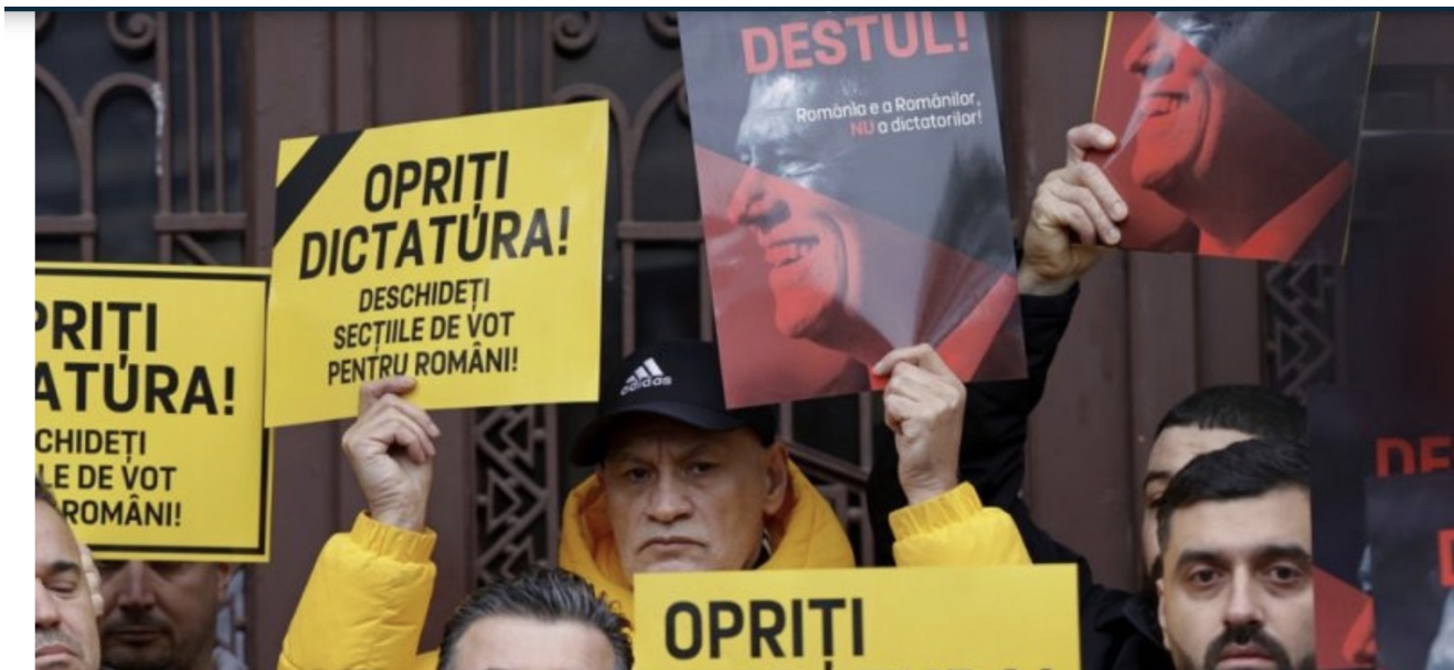
Les partisans de l'Alliance pour l'Unité des Roumains (AUR) écoutent le discours du leader du parti George Simion devant le bureau de vote du Collège national 'Mihai Viteazul' à Bucarest, Roumanie, 08 décembre 2024.

George Simion, président de l'AUR, parti nommé d'extrême-droite par l'opposition et les mondialistes, soutient Călin Georgescu et se présentera aux élections de 2025 si ce dernier est empêché de se présenter par les mondialistes au pouvoir.