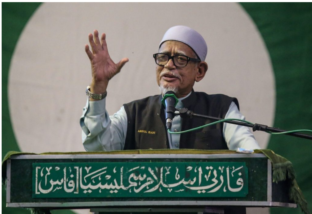
Illustration : Abdul Hadi bin Awang, député et professeur de religion, 7e président du Parti islamique malaisien

Le Département malaisien du développement islamique (Jakim) a précisé aujourd'hui qu'il était acceptable pour les musulmans de dire « Joyeux Noël » aux chrétiens, à condition que ce ne soit pas religieux.