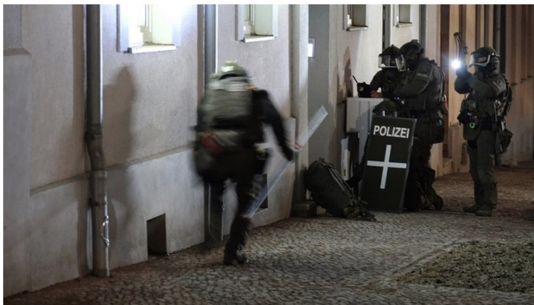
À la suite de l'attentat du marché de Noël à Magdebourg, des policiers ont perquisitionné des bâtiments à Bernburg.