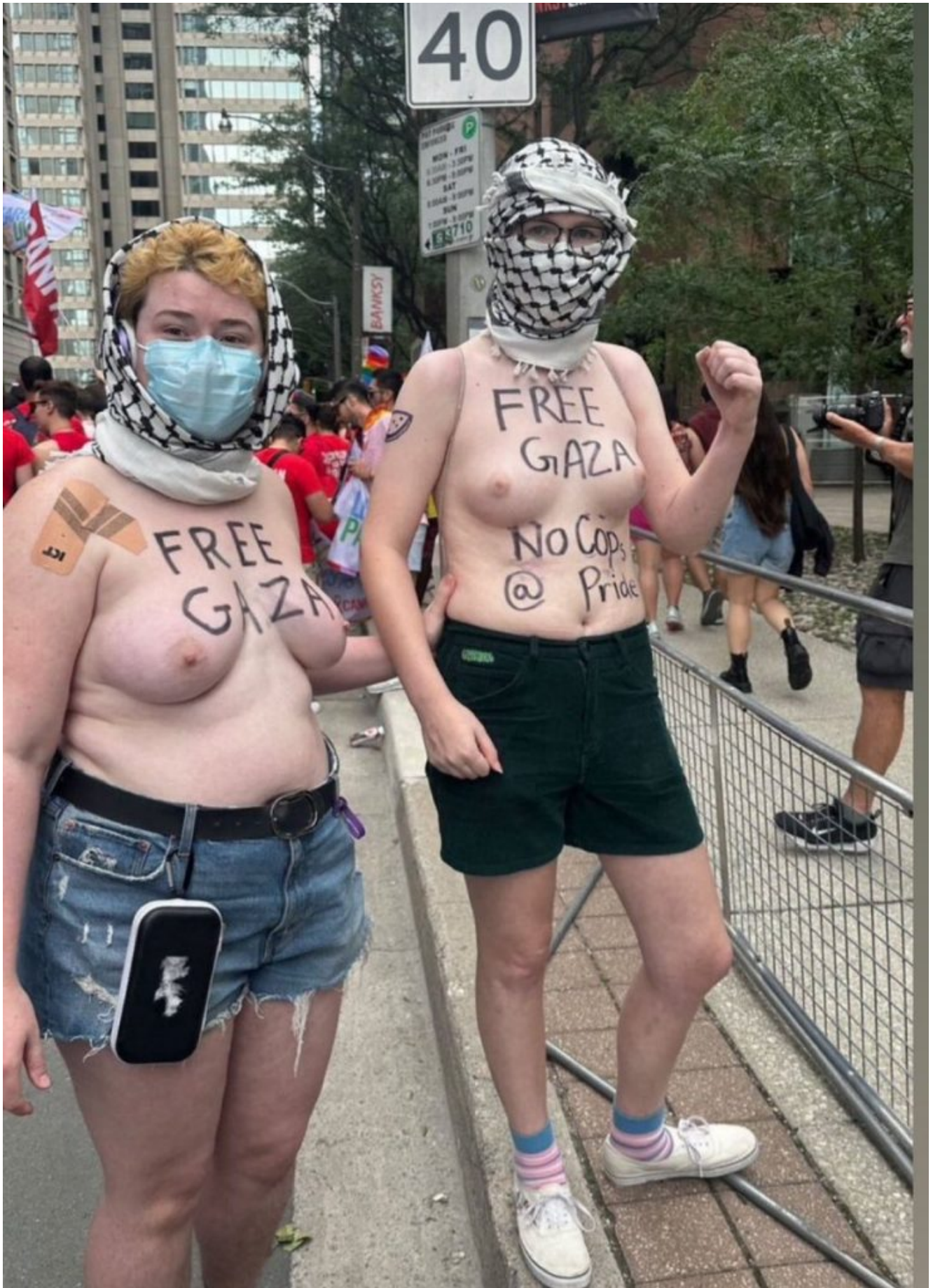
Cette photo de juillet est un signe de la folie des temps: des femens en train de manifester seins nus pour le Hamas...