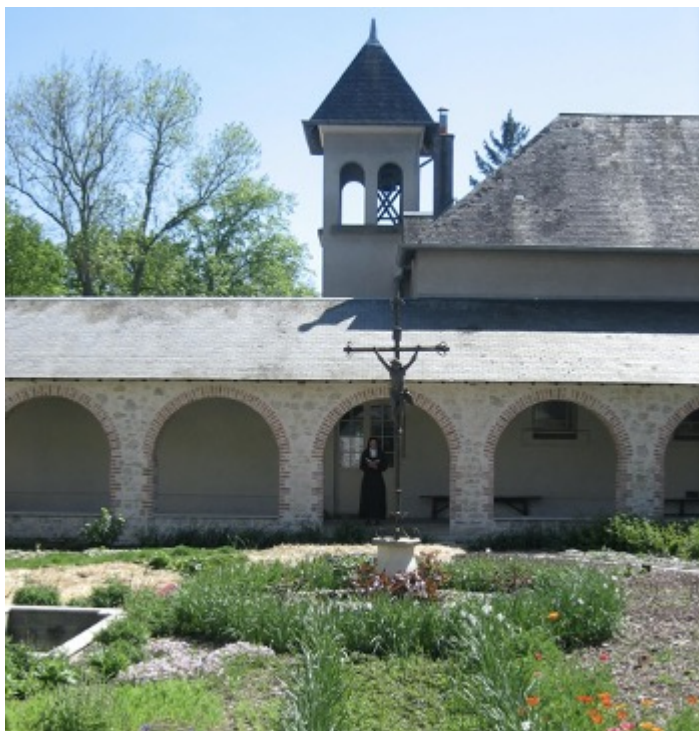
Cloître du carmel de Micy-Orléans

Ce n'est généralement pas une abbaye, et peut être un prieuré, un couvent ou un monastère.