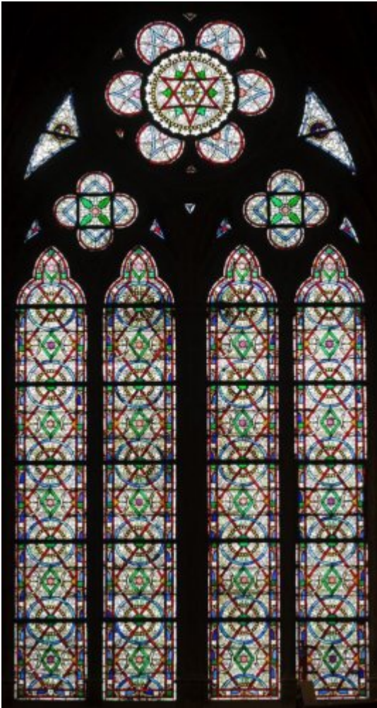
2. Vitrail de la chapelle Sainte-Geneviève (image tirée du cahier des charges techniques et patrimonial du concours)

Ce qui est certain, c'est que la visite du président de la République dans la cathédrale restaurée vendredi dernier, et la vidéo qui en a été diffusée, montre à quel point ces vitraux de Viollet-le-Duc sont parfaitement adaptés à la cathédrale. Même si les copies d'écran que nous publions ici ( ill. 1 et 3) ne sont pas complètement représentatives de leur qualité (l'image est un peu floue, et les couleurs sont affadies), on voit bien que la lumière qu'ils distillent est très belle, Viollet-le-Duc ayant soigneusement dosé ses effets. Nous publions à côté des deux illustrations les photos des vitraux correspondant ( ill. 2 et 4). Les premiers visiteurs du monument vont pouvoir admirer ces