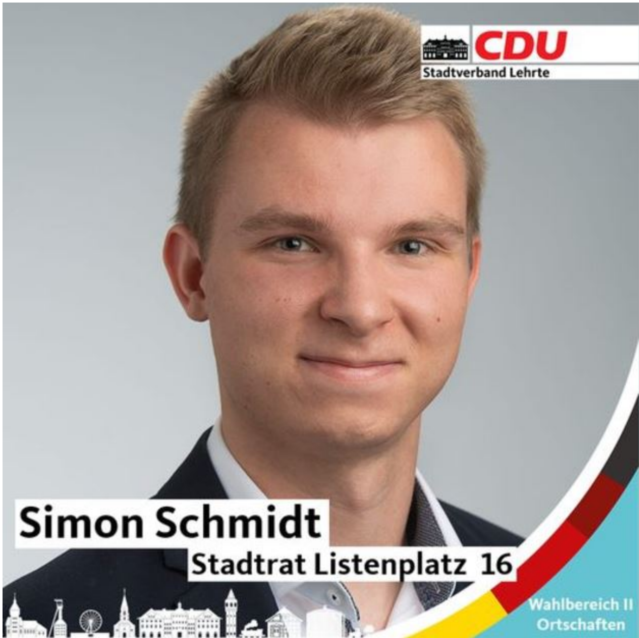
Photo : en 2021, quand le jeune étudiant en génie mécanique était candidat