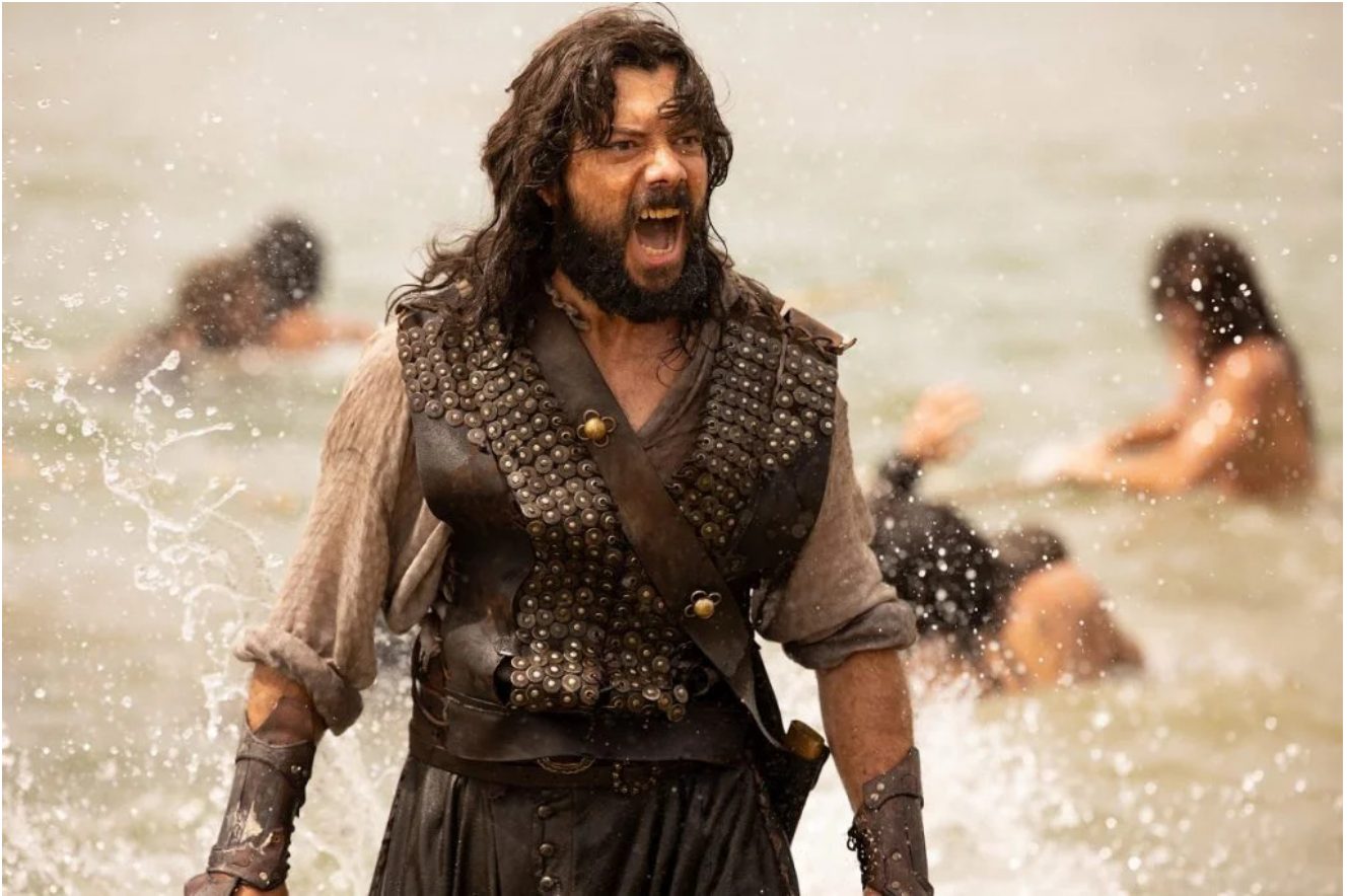
Elcano (Álvaro Morte)