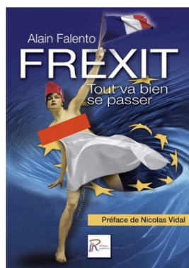
Livre "Frexit, tout va bien se passer" - Alain Falento