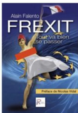
Livre "Frexit, tout va bien se passer" - Alain Falento

APER vous offre l'ouvrage de votre choix : SÉLECTIONNEZ CELUI DE VOTRE CHOIX