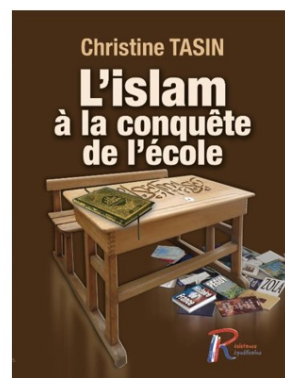
Livre "L'islam à la conquête de l'école" - Christine Tassin