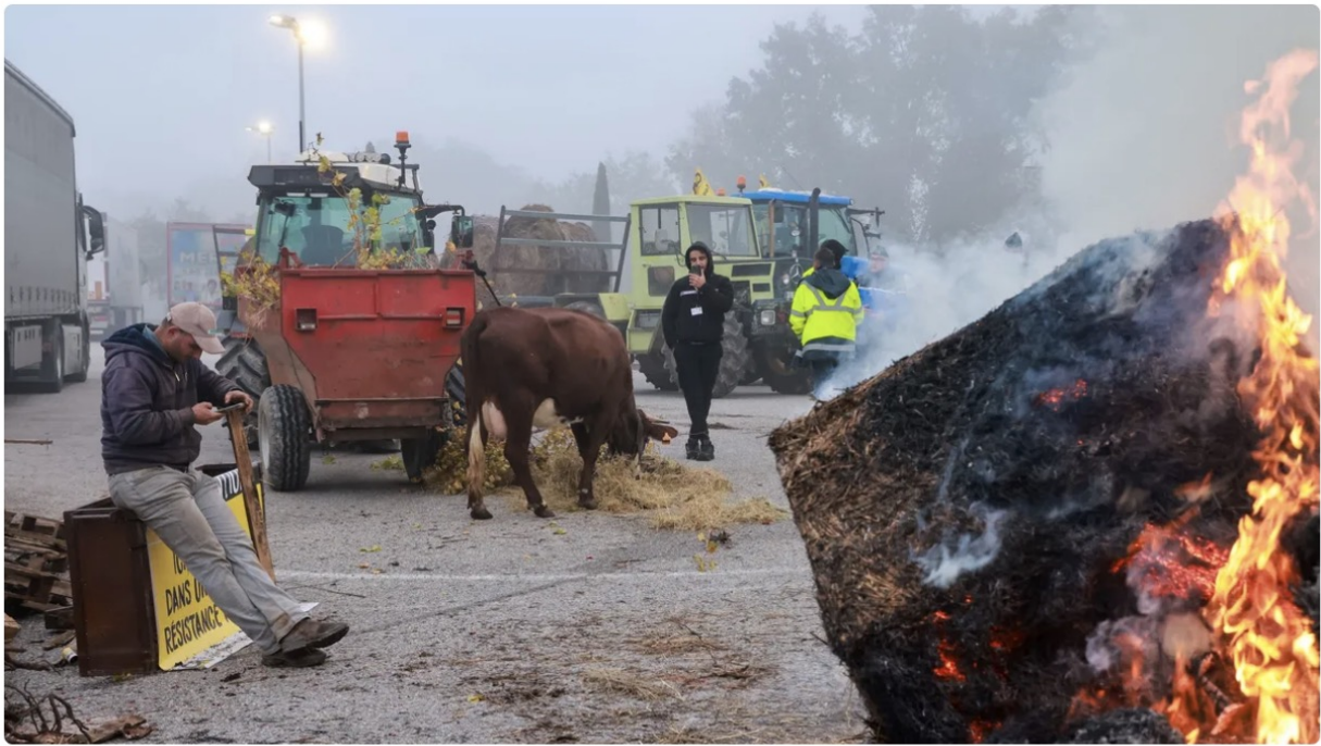
Manifestation des agriculteurs 14 novembre 2024 à Rousset (Bouches-du-Rhône)

Les paysans reprennent le combat dès aujourd'hui, mais pas tous, la FNSEA incarne dans le monde agricole la collaboration avec les fossoyeurs de notre pays.