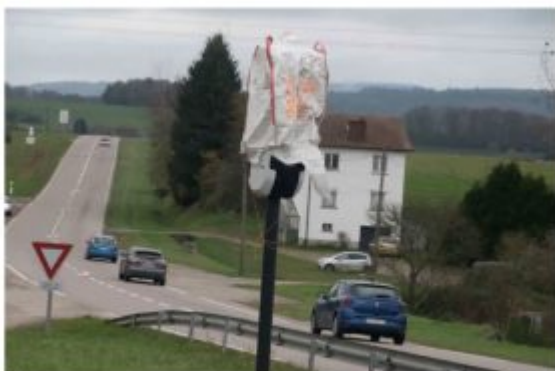
Un radar tourné bâché par les agriculteurs dans les Vosges, le 12 novembre 2024

Castres et à Albi sont d'ores et déjà ciblés pour lundi et mardi prochain. Une dizaine de radars seront recouverts de bâches dans le centre et le sud de la Manche , comme dans le Doubs . Dans l'Eure , les Jeunes agriculteurs ont commencé à végétaliser les radars des communes dans la nuit de vendredi à samedi.