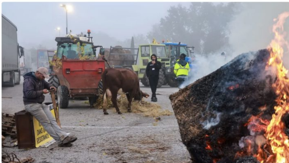
Manifestation des agriculteurs 14 novembre 2024 à Rousset (Bouches-du-Rhône)

écrit par Christine Tasin | 18 novembre 2024