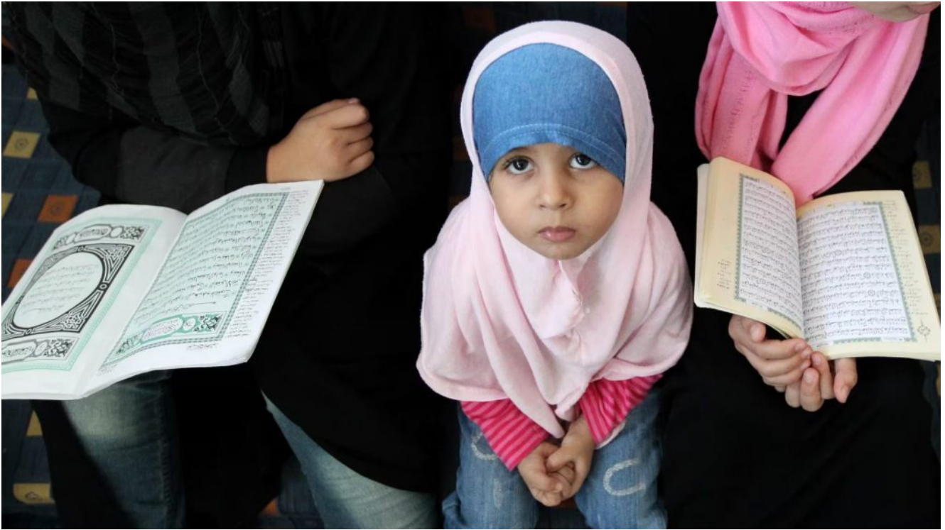
Illustration : des femmes accompagnées d'une fillette lisent le Coran dans une mosquée à Tripoli

La Libye va mettre en place une police des mœurs dans la capitale pour faire respecter la « pudeur » et réprimer les coupes de cheveux « étranges », a déclaré le ministre de l'intérieur du pays.