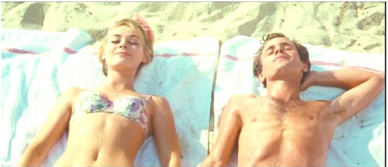
Geneviève Grad et Patrice Laffont « Le gendarme de Saint-Tropez »