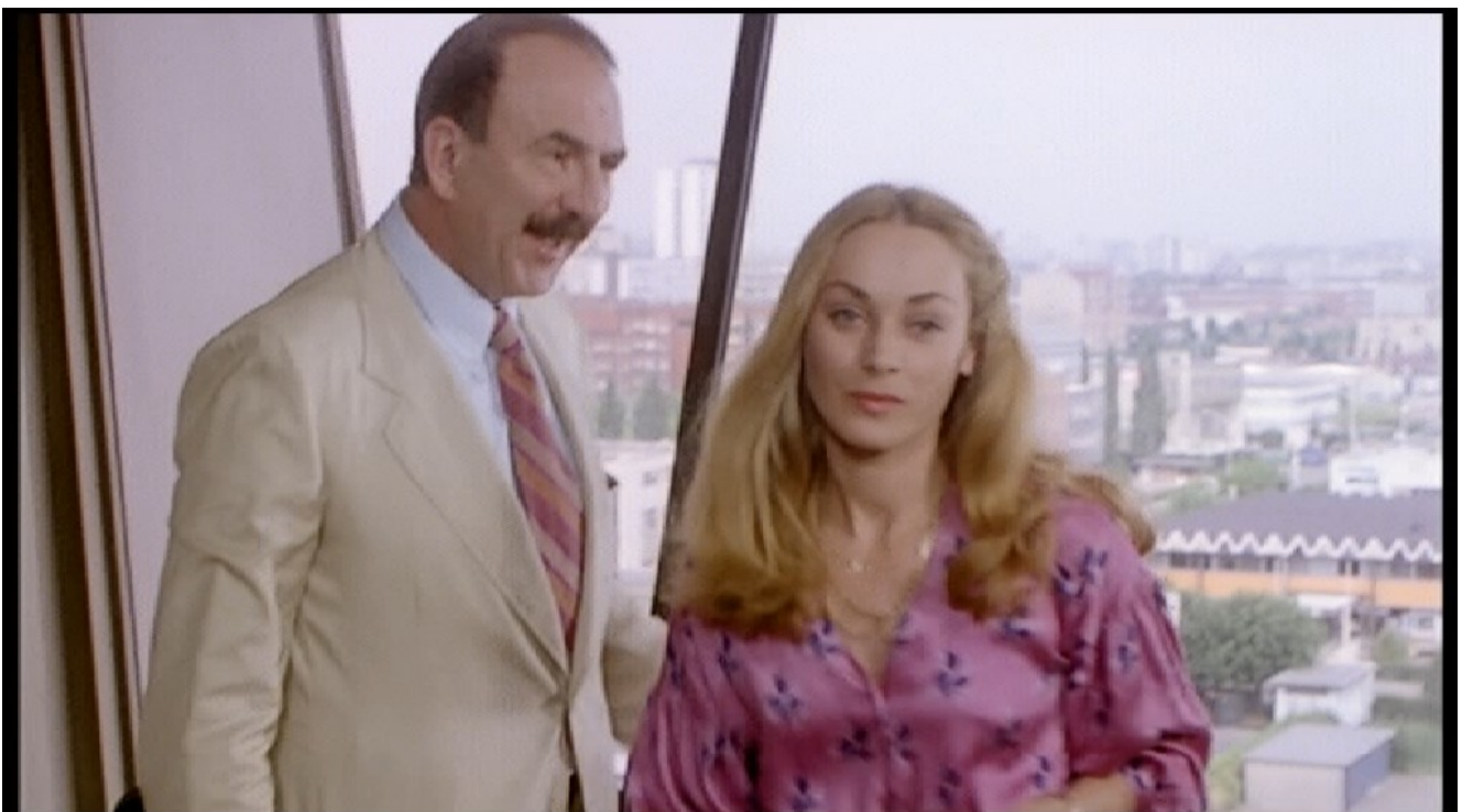
Jean Pierre Marielle et Geneviève Grad « Voulez-vous un bébé Nobel »