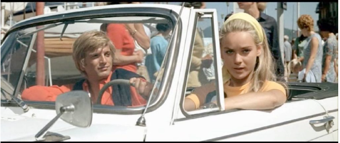
Maurizio Bonuglia et Genevieve Grad « Le gendarme se marie »