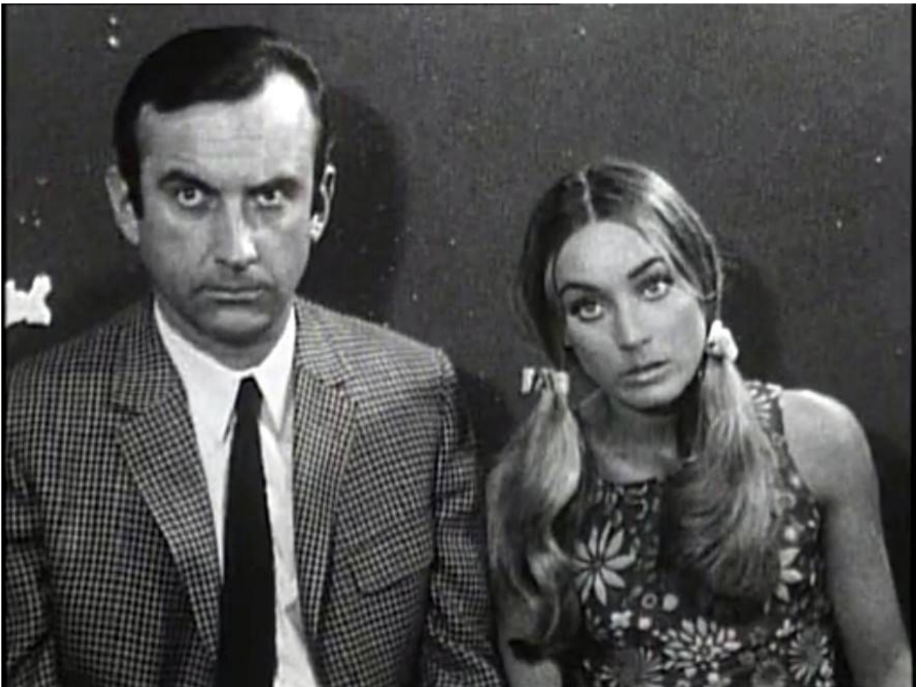
Daniel Ceccaldi Geneviève Grad « Agence Intérim »