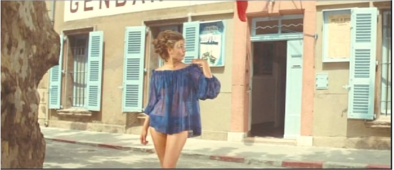
Geneviève Grad « Le gendarme de Saint-Tropez »