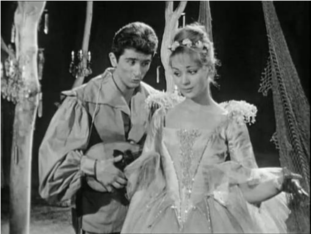
Marcel Amont et Geneviève Grad « A quoi rêvent les jeunes filles »