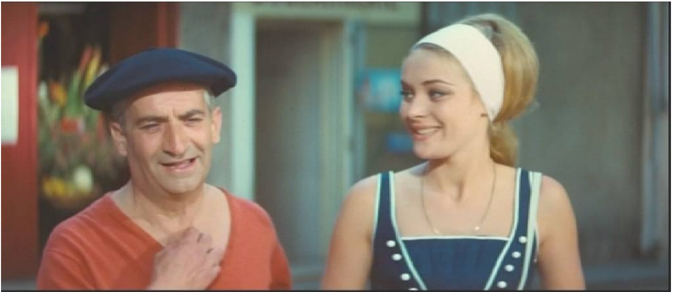
Louis de Funès et Geneviève Grad « Le gendarme de Saint-Tropez »