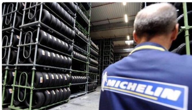
Un salarié dans l'usine Michelin de Cholet.

Du lundi au vendredi, l'actualité des entreprises