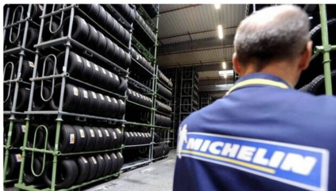
Un salarié dans l'usine Michelin de Cholet.

Du lundi au vendredi, l'actualité des entreprises