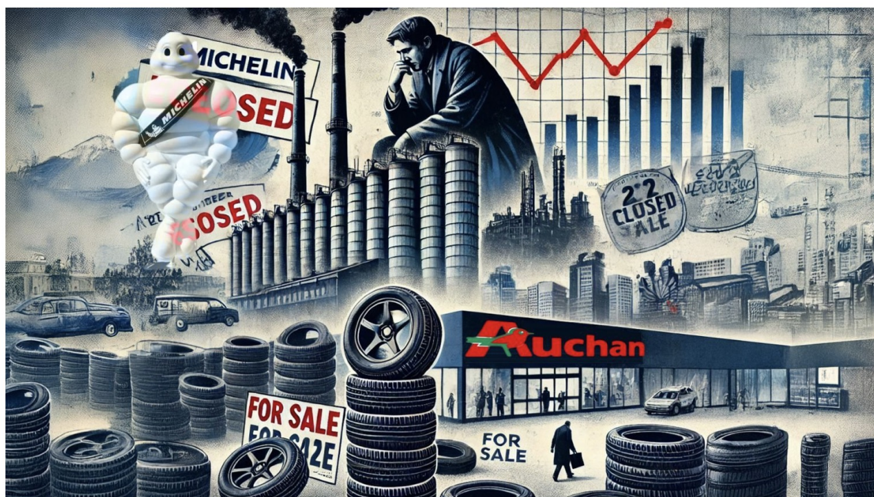
Michelin et Auchan ferment des usines et licencient des milliers de salariés.