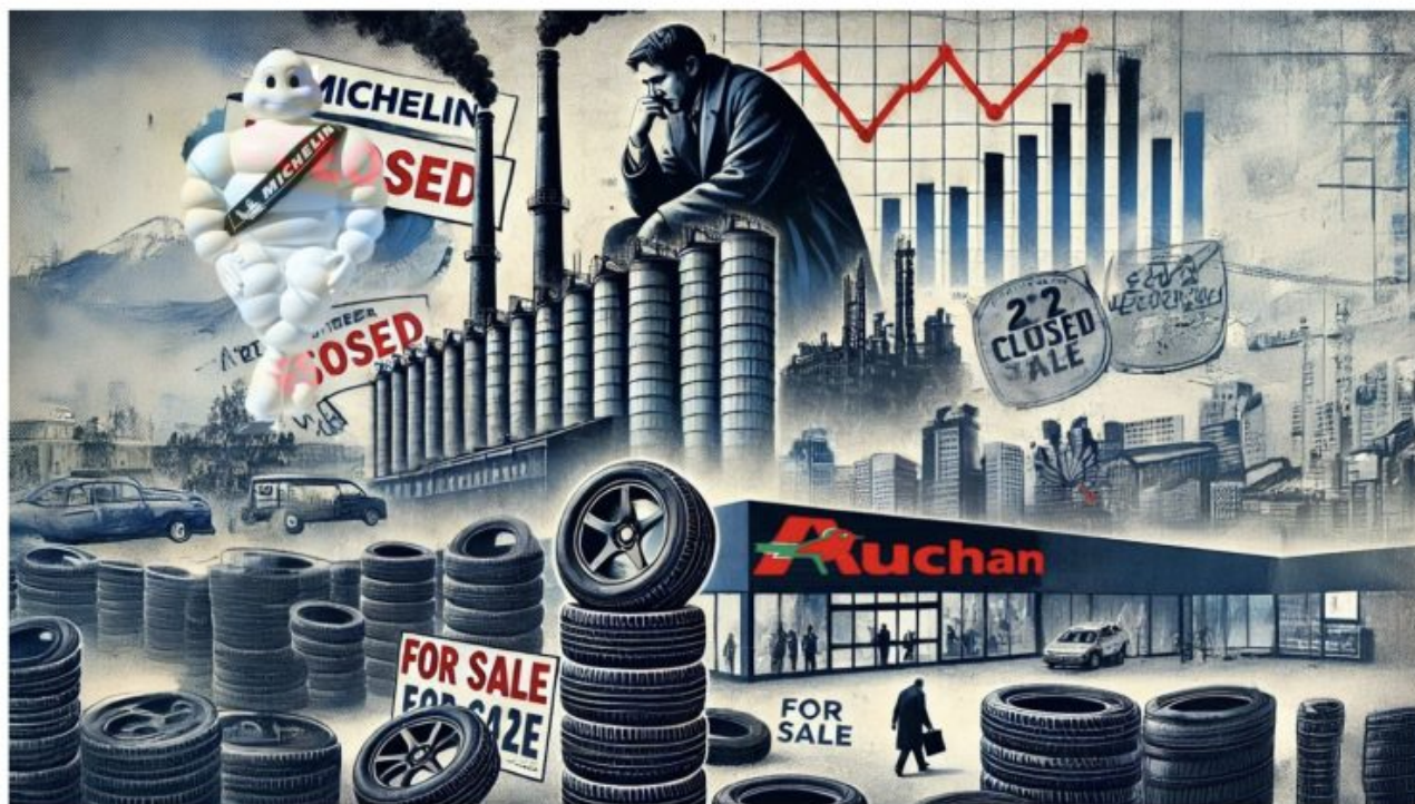
Michelin et Auchan ferment des usines et licencient des milliers de salariés.