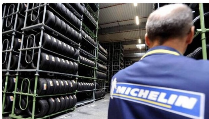
Un salarié dans l'usine Michelin de Cholet.

Du lundi au vendredi, l'actualité des entreprises