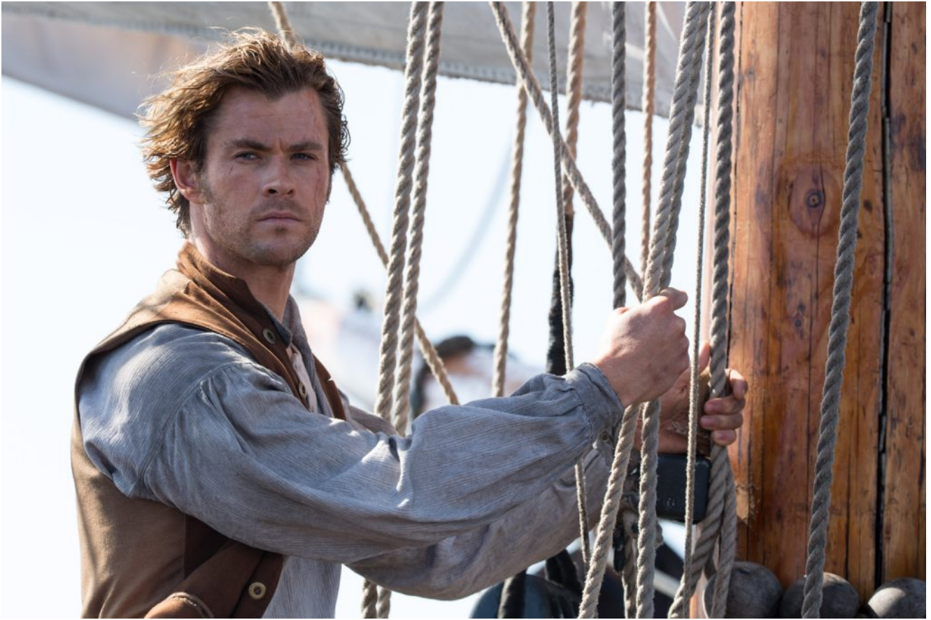
Le Hemsworth qui prend la mer