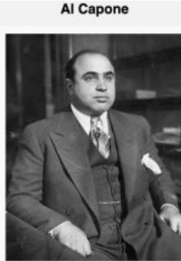
Al Capone Capone lors de son arrestation comme ennemi public n° 1 en 1930, photo prise dans les locaux de la police de Chicago.