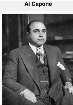
Al Capone Capone lors de son arrestation comme ennemi public n° 1 en 1930, photo prise dans les locaux de la police de Chicago.