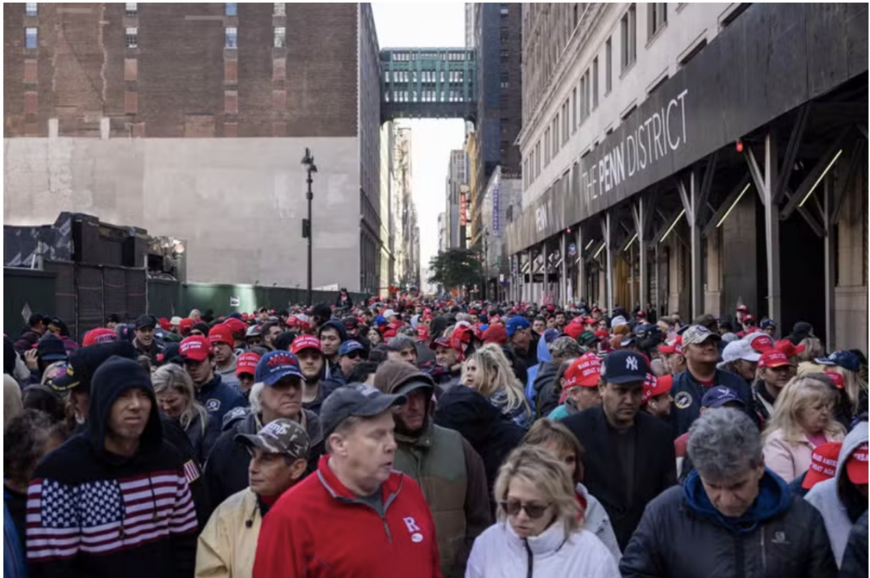
Des partisans de Donald Trump dans les rues de New York, le 27 novembre 2024.