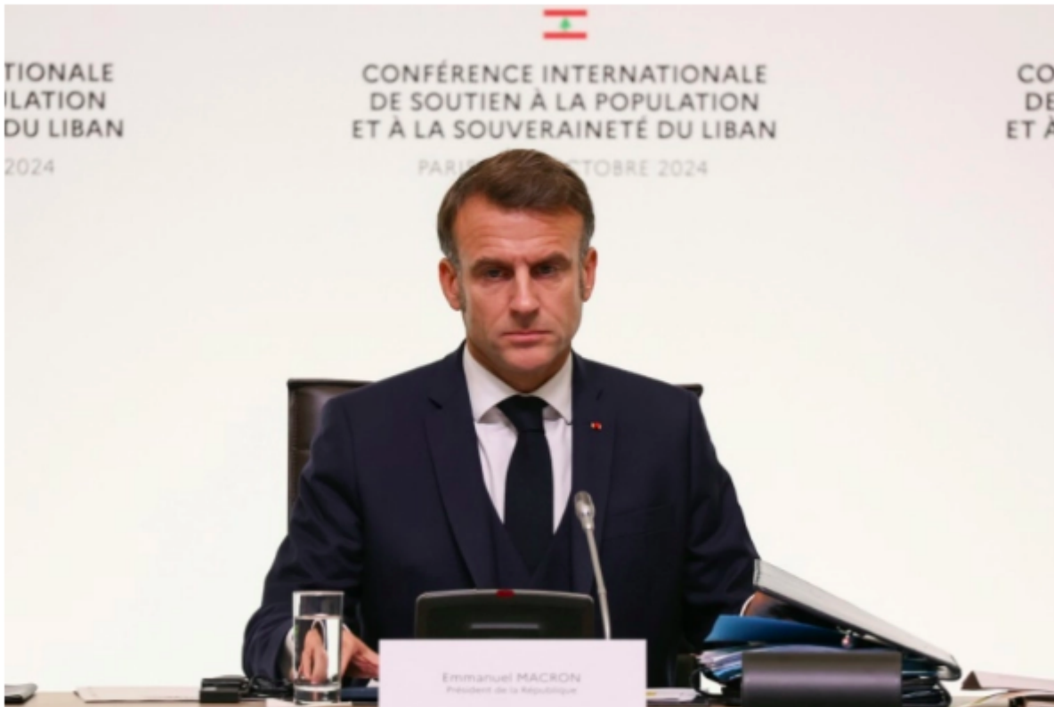
Emmanuel Macron lors de la conférence internationale sur le Liban, à Paris, le 24 octobre 2024