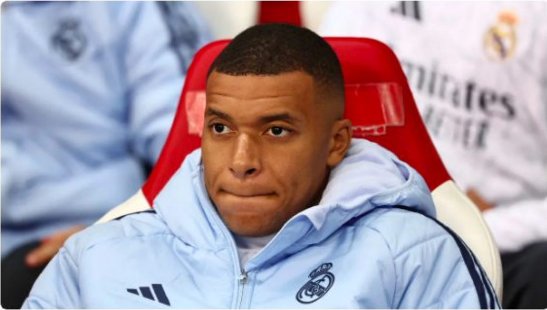
Real Madrid's French forward #09 Kylian Mbappe looks on from the bench during the UEFA Champions League football match between Lille LOSC and Real Madrid at the Pierre Mauroy Stadium in Villeneuve-d'Ascq, northern France, on October 2, 2024.

□ Mais là n'est pas le sujet de ce point de vue : je veux simplement comparer les réactions de certains et surtout de certaines lorsque des accusés de viol sont, au hasard, d'un côté, des joueurs de rugby en déplacement en Argentine, et, de l'autre, un joueur de football en déplacement en Suède... Lorsque fut déclenchée l'affaire des deux joueurs de rugby, ce fut l'hallali à l'adresse des deux internationaux tant de la part de nombreux confrères journalistes que d'associations féministes voire de personnalités du monde politique. Voyez (2), sur cet aspect du traitement d'une information, les articles parus sur RR, l'un des rares sites n'ayant pas crié haro sur eux.