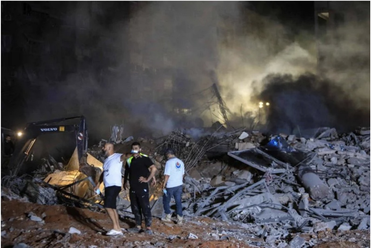
Des bâtiments en ruine après la frappe israélienne contre la banlieue sud de Beyrouth ce vendredi.

https://www.lorientlejour.com/article/1428879/israel-fait-le-choix-de-la-guerre-totale-au-liban.html [