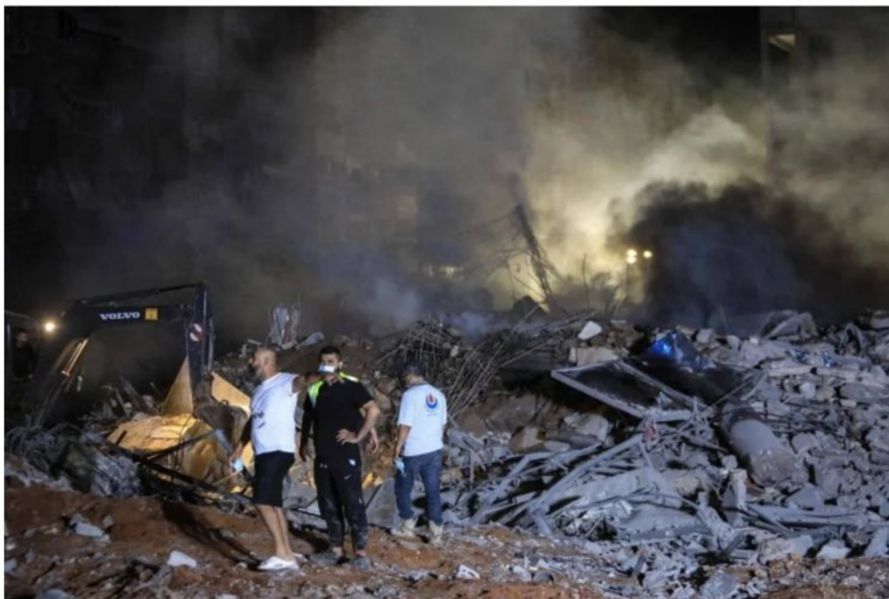
Des bâtiments en ruine après la frappe israélienne contre la banlieue sud de Beyrouth ce vendredi.

écrit par Christine Tasin | 28 septembre 2024