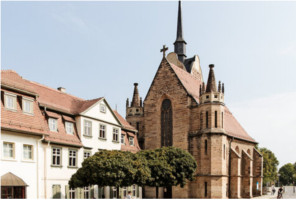
L'église Sainte Marie, ville de Gera

Apparemment, le Syrien a été gêné par un deuxième pendentif que le retraité portait autour du cou et s'est senti atteint dans ses sentiments religieux. L'immigré, arrivé en Allemagne en 2015, n'a pas donné d'autres informations.