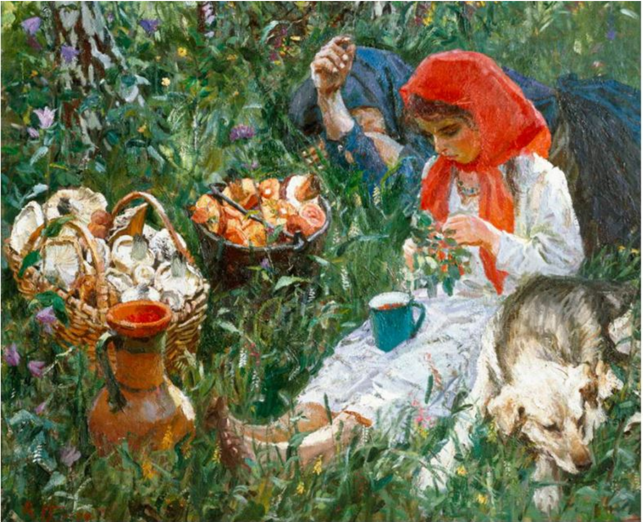
Arkadi Plastov. En été. Champignons , 1953-1954

Léon Tolstoï décrit une scène d'apaisement entre la princesse Daria Alexandrovna Oblonskaya et ses enfants, autour d'une balade sylvestre à la recherche des champignons :