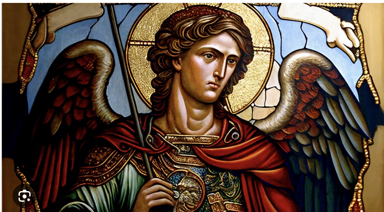
Saint Michel, le patron des anges...