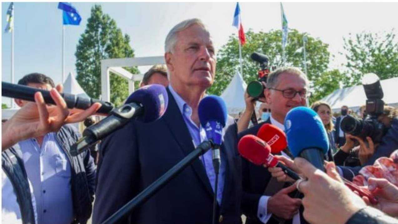
Michel Barnier à la Baule, en Loire-Atlantique, le 28 août 2021, pour les Universités d'été du parti Les Républicains

L'ancien commissaire européen et négociateur du Brexit dit vouloir gouverner le pays avec les autres candidats de la droite. Il critique la "gestion solitaire" d'Emmanuel Macron.