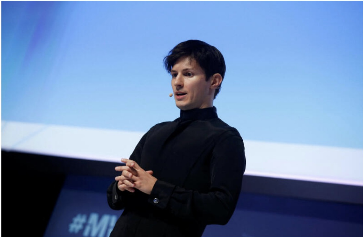
Pavel Durov, à Barcelone, le 23 février 2016.