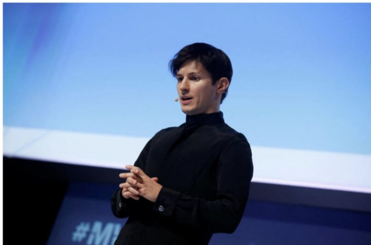
Pavel Durov, à Barcelone, le 23 février 2016.