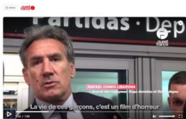
VIDÉO. Affaire Jegou-Auradou : les rugbymen français inculpés de viol quittent l'Argentine

« Il ne faut pas, s'ils sont innocentés, qu'ils soient exclus de leur sport ! »□