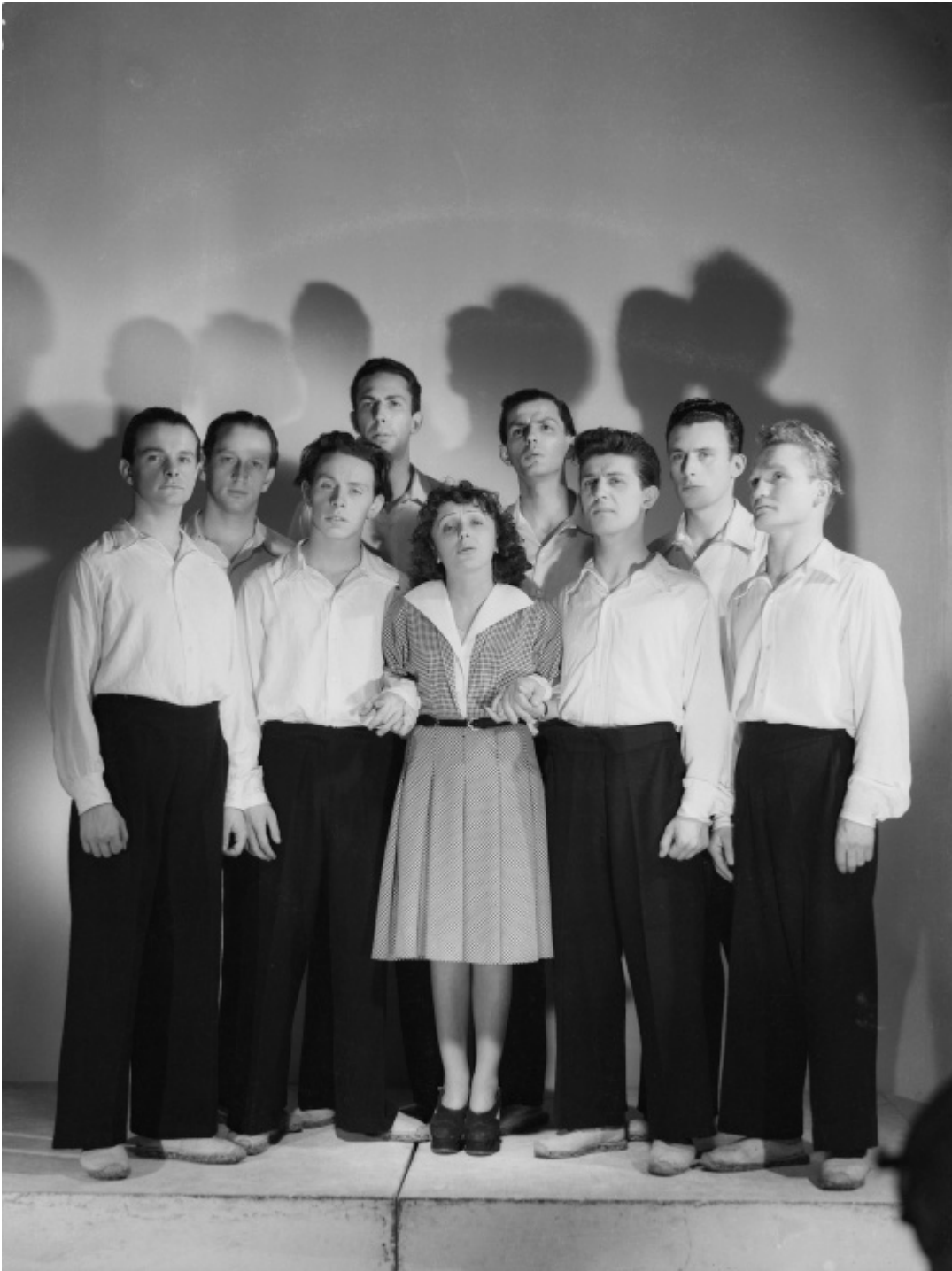
Edith Piaf et les Compagnons de la chanson en 1946

On a évoqué l' »Hymne à l'amour » mais Piaf, c'était aussi dans le cœur des Français la chanson « Les Trois Cloches » , au texte plein de sens, qui décrit le passage du temps, rythmé par les sonneries des cloches d'un village, annonçant les grands événements de la vie : naissance, mariage et mort.