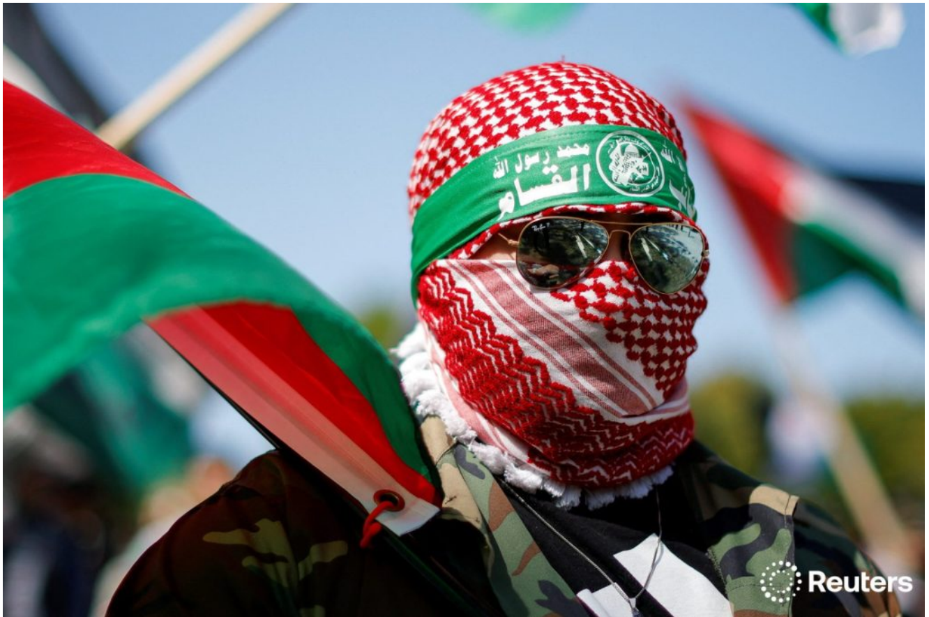
Photo : à Chicago, un manifestant participe à une manifestation de soutien aux Palestiniens, en marge de la Convention nationale du parti démocrate (DNC).