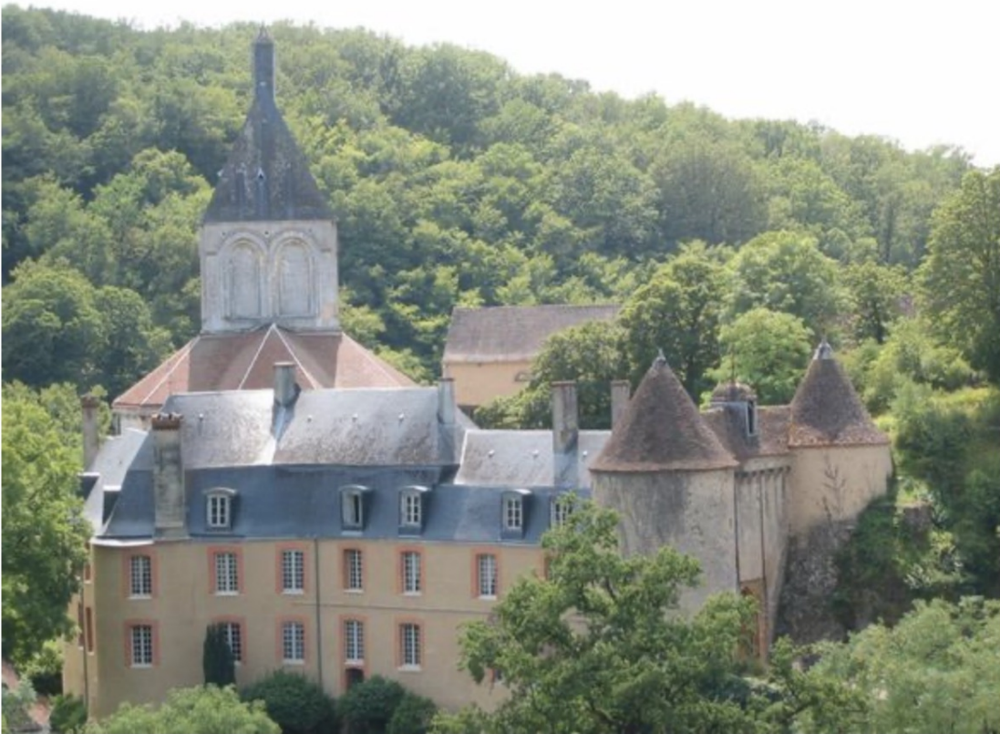
Reconstruit sur des ruines féodales au XVIIIe siècle, le château est accolé à une église romane du XIIe. (Photo d'archives) © Elsa Charnay

Le château de Gargilles-Dampierre (Indre) a été racheté il y a quelques mois par le commissaire européen Thierry Breton. S'il préfère rester discret sur cette acquisition, il souhaite que la vocation artistique, impulsée par l'ancienne propriétaire, perdure.