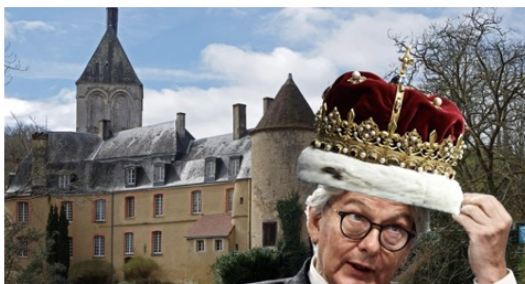
Monsieur Vaccin et son château.

Son Excellence Thierry Breton, Haut Commissaire au Marché Intérieur de la Fédération Européenne et maître des fichiers qu'on nous introduit dans l'Union (1) est devenu Châtelain de Gargillesse-Dampierre (Indre) (2), il y a quelque temps.