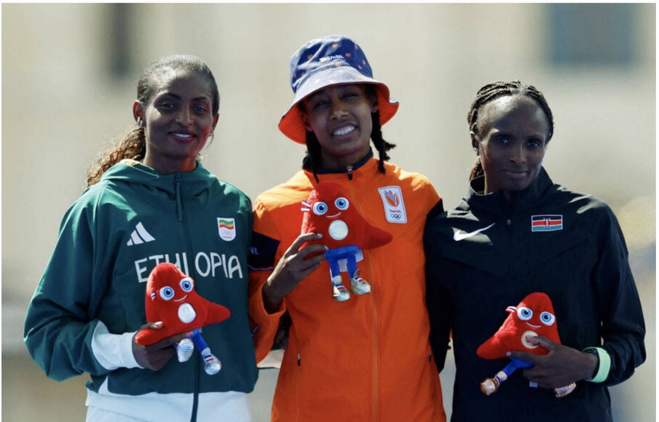
Sifan Hassan a battu le record olympique en 2h06'26".

Un crachat à la France et à ses principes qui l'a accueillie