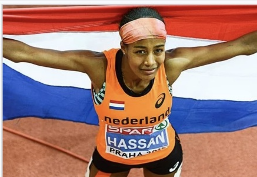
Sifan Hassan célébrant son titre à Prague en 2015.

En tout cas je la soupçonne d'avoir rencontré -épousé ?- un bon musulman (et plus si affinités, à moins que depuis le début elle n'ait été prise en mains par une organisation de Frères musulmans...) car les premières photos d'elle sur les stades étaient cheveux nus, puis un bandeau... puis un turban, puis un chapeau, jusqu'à l'apothéose finale d'hier soir, voilée jusqu'aux dents. Un crachat à l'Occident.